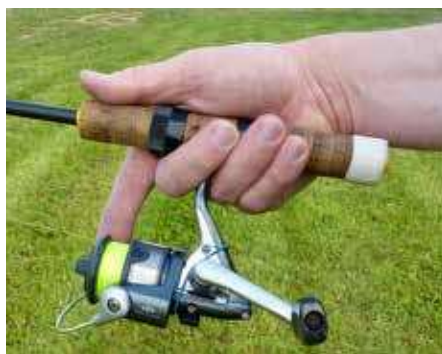
Bild 1: Griffhaltung mit dem Bremsfinger am Spulenrand

die Gestaltung des Rollenfußes ist für viele Angler ein Grund, eine für die Kontrolle der Schnur beim Wurf ungünstige Griffstellung zu wählen.