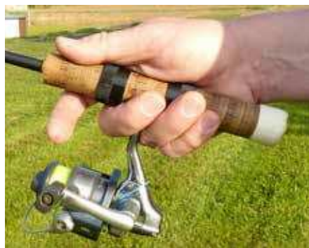
Bild 2: Griffhaltung Finger in Schnurspannungsstellung

Zuerst beginnt man mit einigen Griffübungen. Dabei geht es um die sichere Handhabung der Rolle und die Kontrolle der zuerst fixierten und dann der